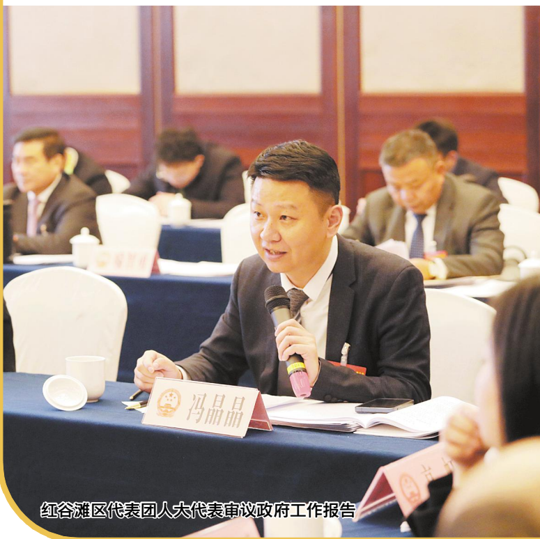
红谷滩区代表团人大代表审议政府工作报告

2025年,我们将聚焦教育优质均衡发展这一项工作,将学校各个硬件软件都朝着国家优质均衡的方向去打拼。教师队伍是实现教育优质均衡发展的一个核心支撑。我们将加大人才体系的建设,为教师提供更多专业化的专业成长平台,提升教学能力与教育理念。同时,作为教育界别的政协委员,接下来我们还要努力增强履职本领,为全面推动南昌高质量发展贡献自己的力量。