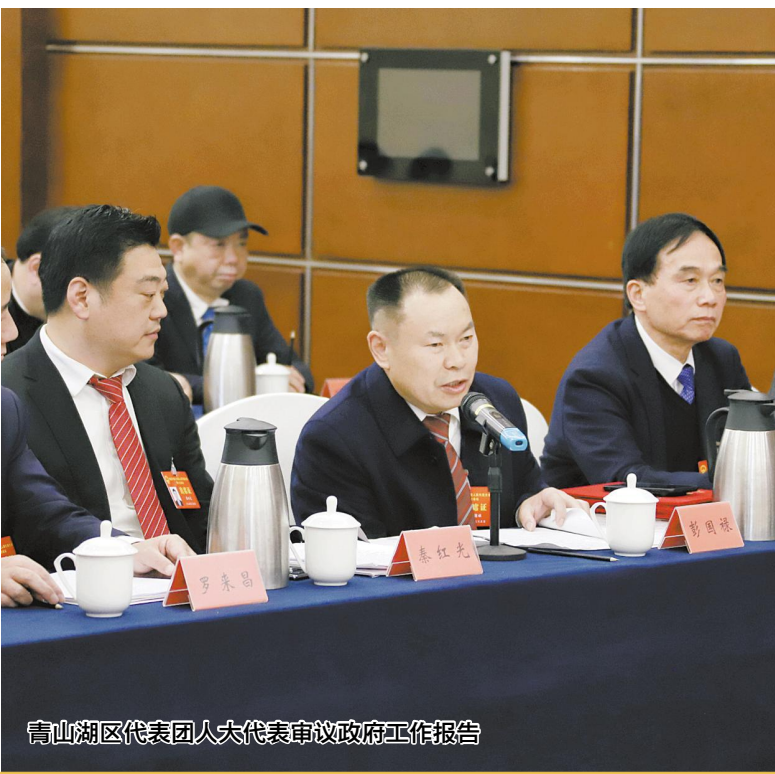
青山湖区代表团人大代表审议政府工作报告