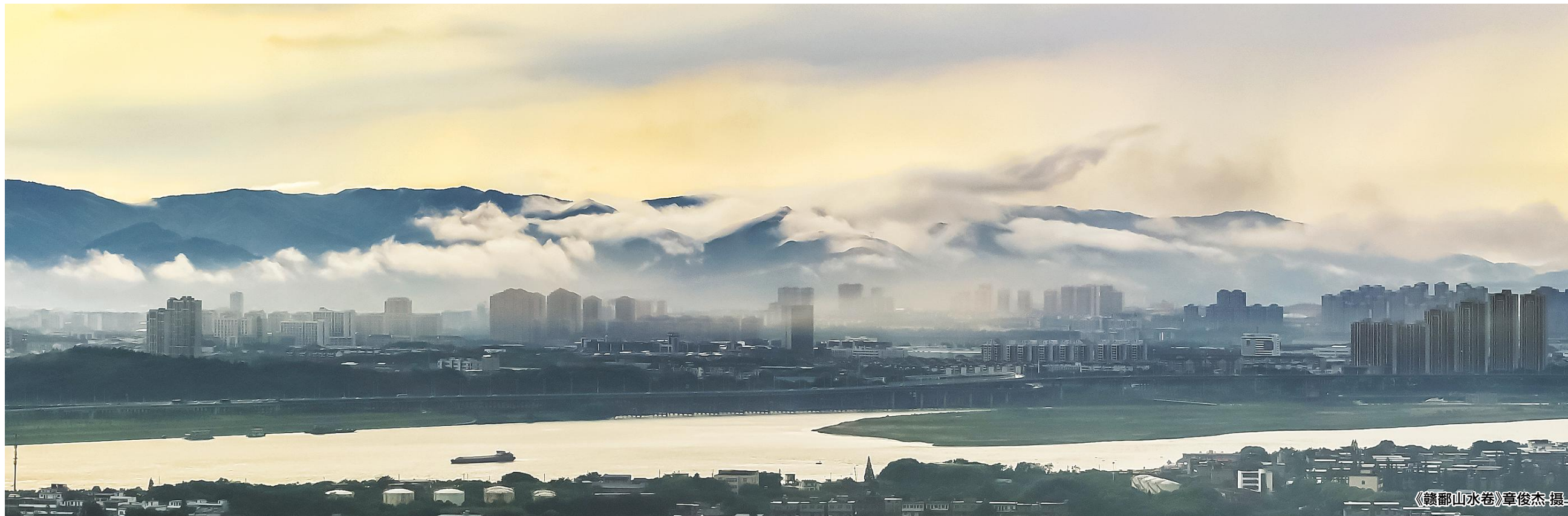
《赣鄱山水卷》章俊杰 摄