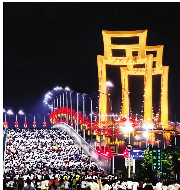
《灯火洪州，奔赴星河》熊长军 摄