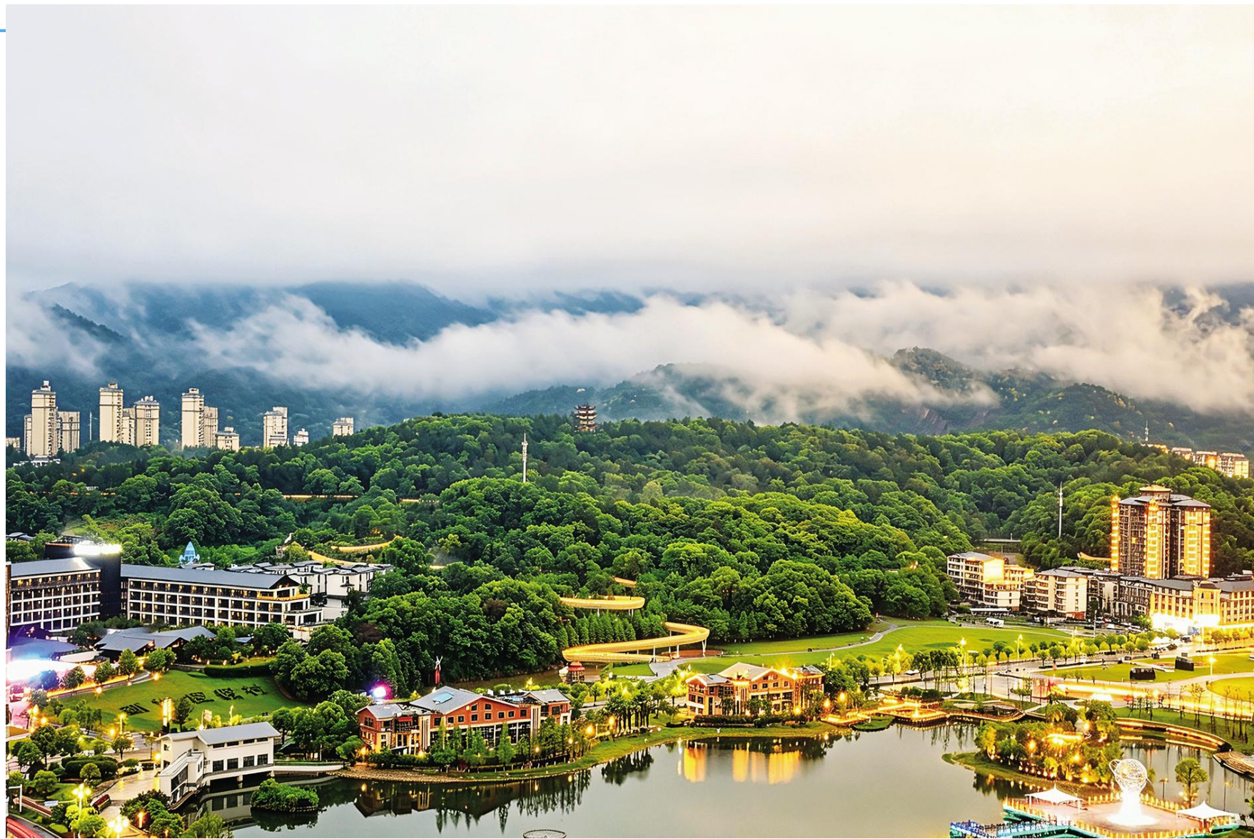
《云栖湾里 山沐清晖》